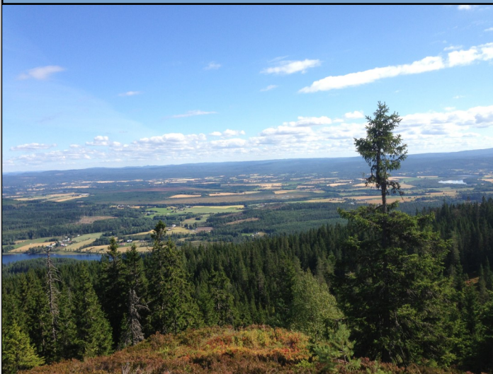
Utsikt fra Fjøråsen mot øst