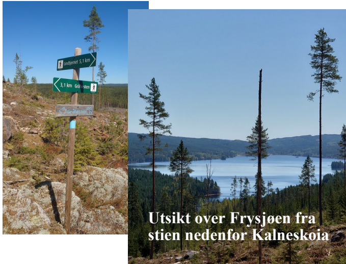
Utsikt over Frysjøen fra stien nedenfor Kalneskoia

Registrering på turmålet: I UT-appen er det kart og du kan registrere deg i den digitale turboka SjekkUt.