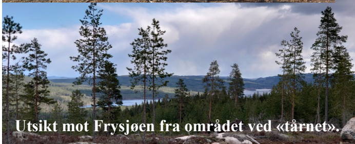
Utsikt mot Frysjøen fra området ved «tårnet».