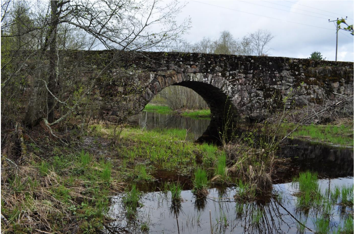
Figur 3: Gamle Piksrud steinhvelvsbru og Kveia sett mot vest under vårflo

De følgende bilder er tatt av undertegnede våren 2019: