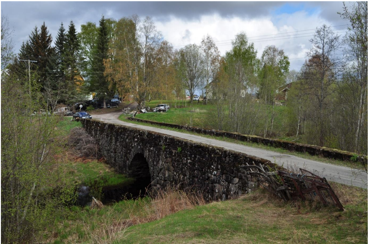
Figur 4: Brua sett mot nord og gården Piksrud