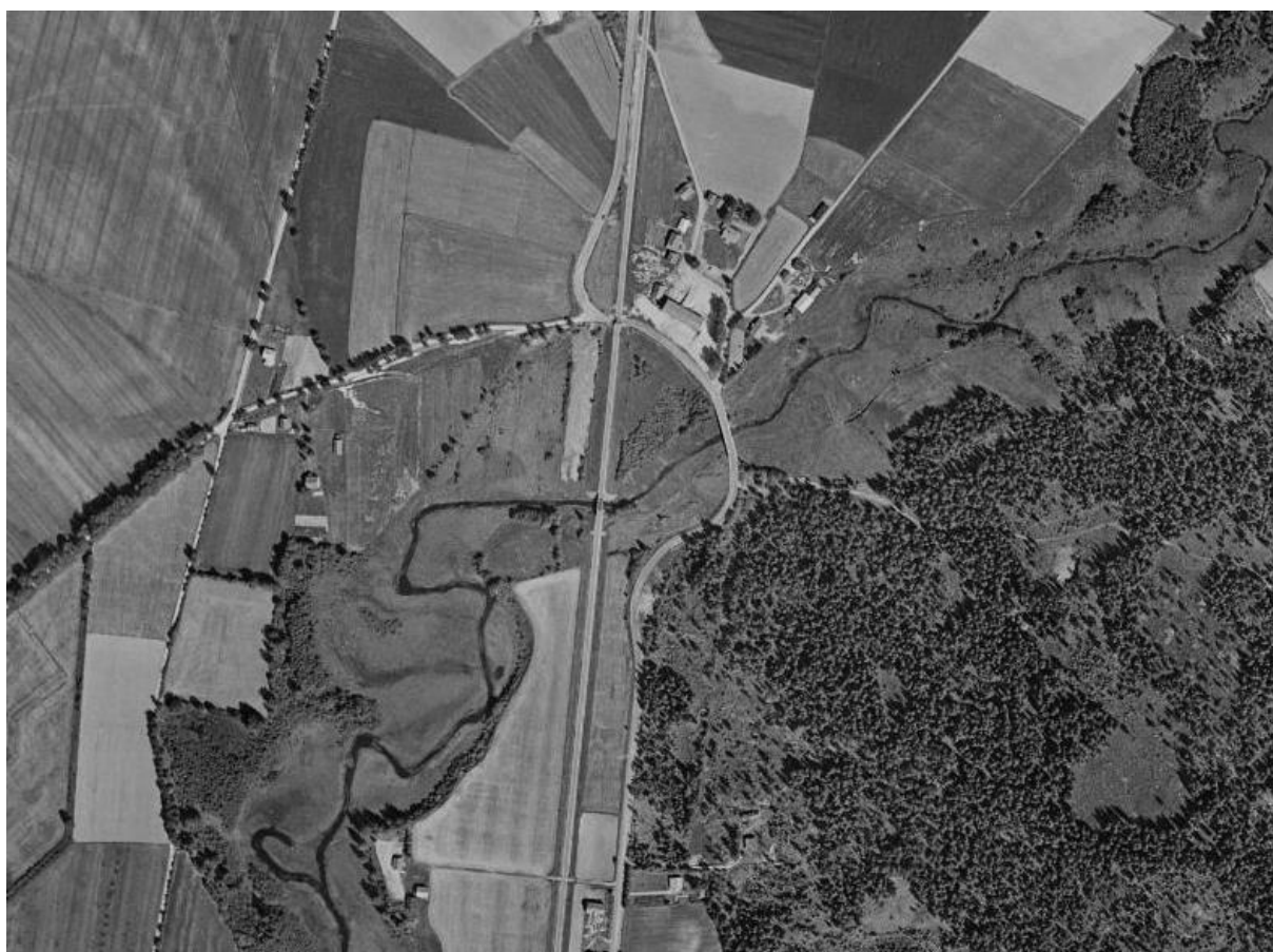
Figur 2: Vegsystemet ved Piksrud i 1960